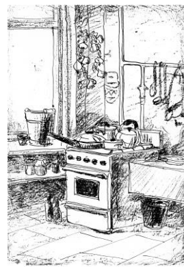
16. А. Кара. Кухня. Нарис. 1980.