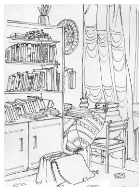
15. А. Кара. Интер'єр. 1986.